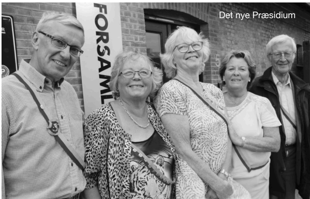
Det nye Præsidium