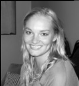
Instruktør 2013 - side 2