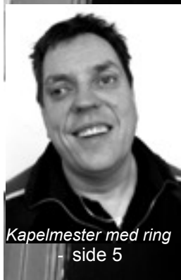
Kapelmester med ring - side 5