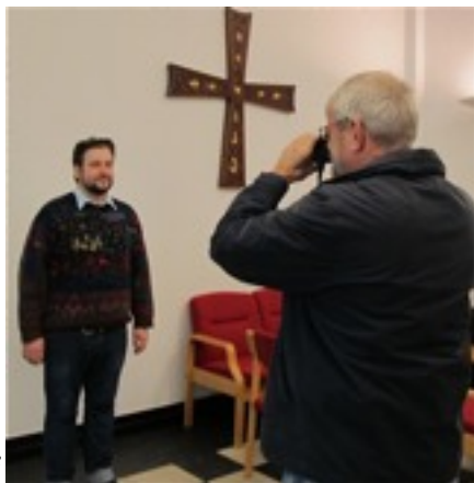
mens Kgl. Mayestais Acteurs' hoffotograf er i aktion - her med den ene af instruktørerne