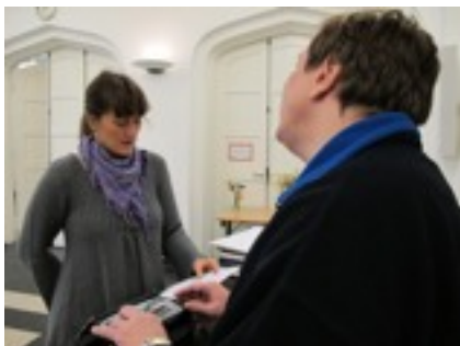
Præsident og pianist aftaler forløbet

Lørdag den 5. november 2011 afholdtes i Samuelskirken på Nørrebro den første audition med 11 aspiranter. Alle fremførte en sang og en tekst af eget valg. Med supplerende udfordringer fra pianisten.