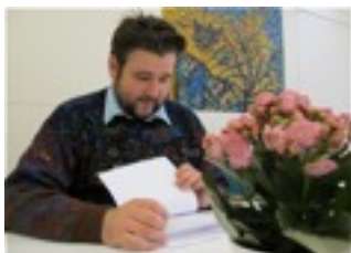
Rækkefølgen tjekkes en ekstra gang