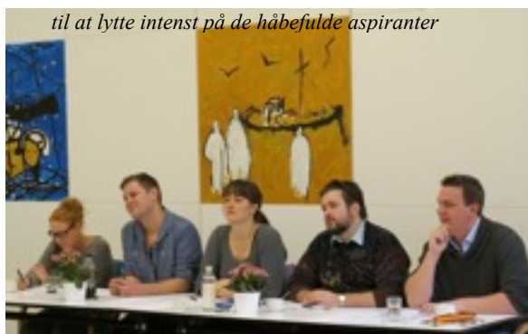
til at lytte intenst på de håbefulde aspiranter

Lørdag den 12. november afholdes anden audition med ca. 8 aspiranter. Vi venter spændt på resultatet af dommerkomiteens afgørelser.