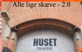
Alle lige skæve - 2.0