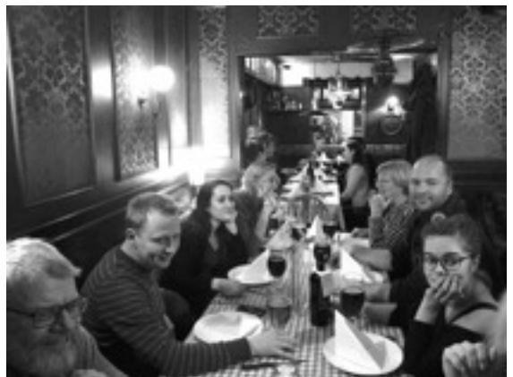
- og afslapning ved opstartsfest i "Klubben"