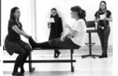
Prøver i AFUKs lokaler