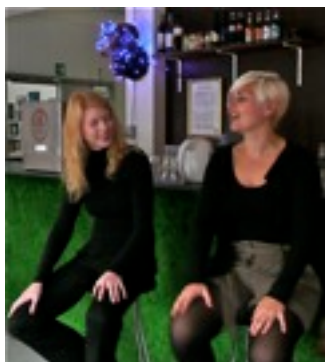
Den kække instruktørduo