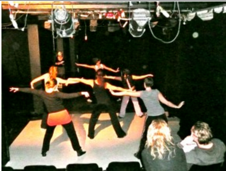
Audition til Revyen 2011 - en af øvelserne var Zumba-dans