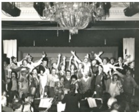
Slutapoteosen fra Skærsommersalat - alle mand på scenen!

"Det overdådigste teater i byen..." skrev Kistrup.