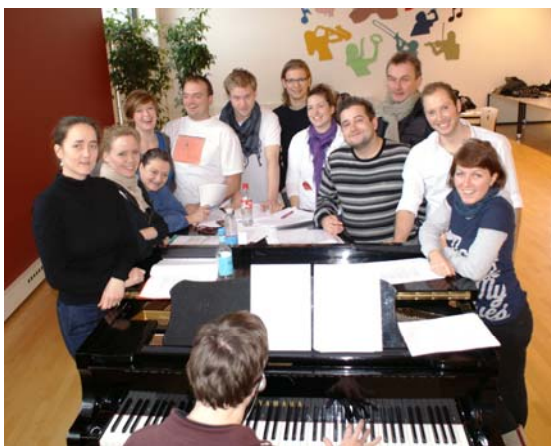
Instruktør, komponist, pianist og skuespillere